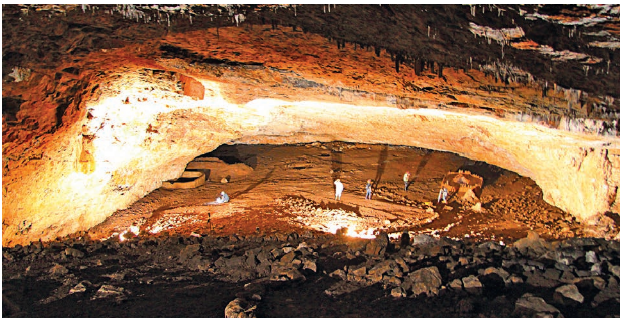
Illuminazione della grotta Azzurra per il rilievo fotografico.