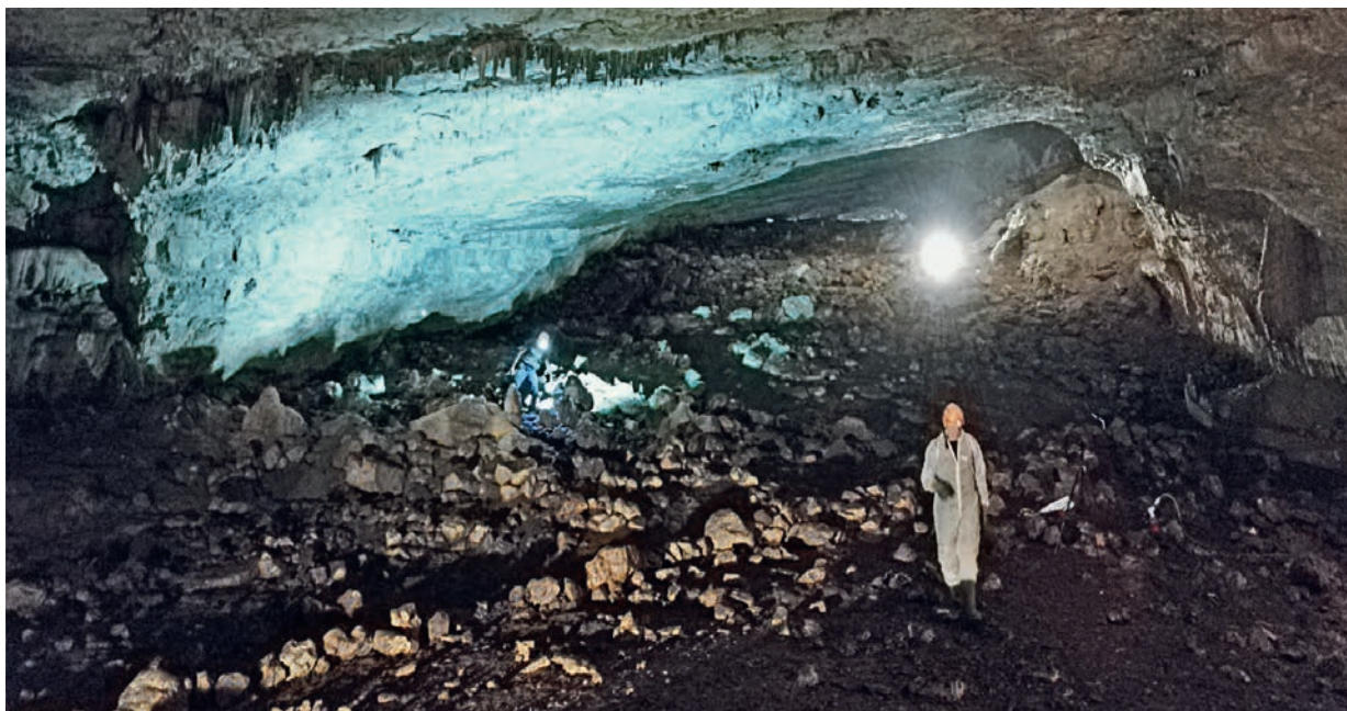
Ingresso della grotta Azzurra, visto dal fondo.

Le grotte erano una risorsa molto utile offerta dal Carso all'esercito austro-ungarico e risultarono fondamentali per l'inviolabilità della linea difensiva del fronte. Proprio per questo motivo, venne istituito un reparto addetto alla ricerca, alla modifica e allo sfruttamento delle grotte presenti sulle linee del fronte e nelle retrovie; fu realizzato addirittura un manuale di queste pratiche, intitolato Der Kavernenbau .