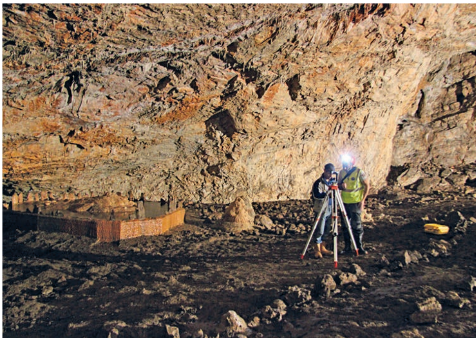
Strumentazione fotografica utilizzata per le panoramiche a 360^\circ .

Rappresentazione in coordinate polari sferiche, dove \varphi è l'angolo polare e \theta è l'azimut del punto P posto a distanza r dal centro O della sfera.