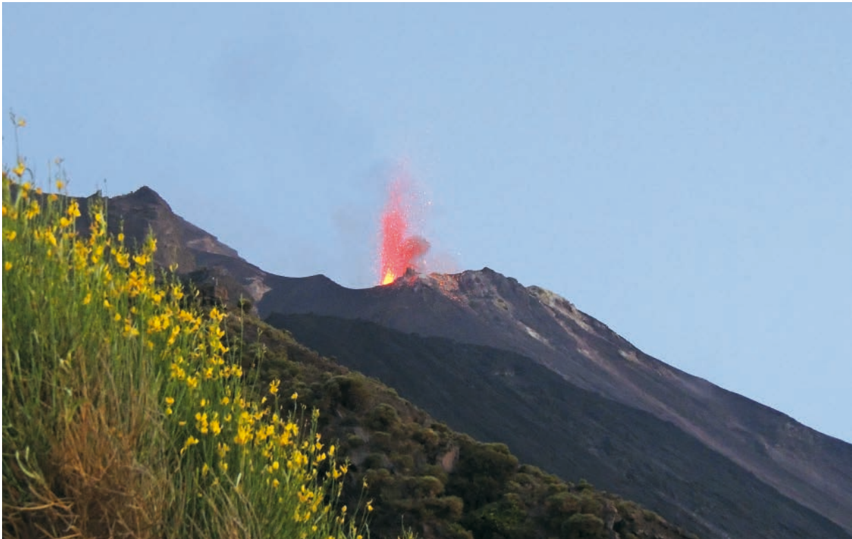
Il vulcano Stromboli.