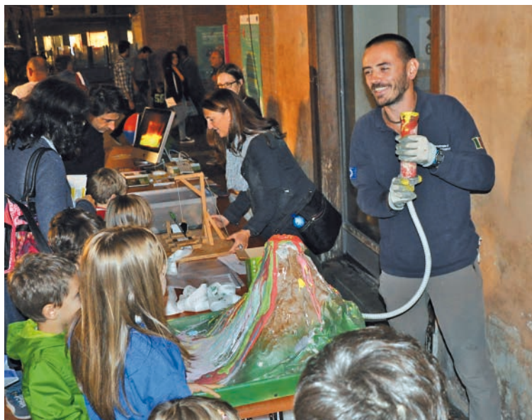
Notte dei ricercatori a Bologna: sono occasioni come queste a favorire il dialogo tra comunità scientifica e società.