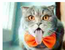
Melissa, la gatta che fa sempre la linguacc...