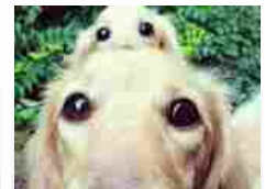
Cuccioli adorabili, tale padre tale figlio ...