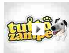
Cuccioli di cane che dormono beati (video)