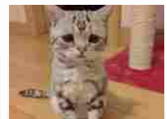
Gatto felice, ma la sua espressione è semp...