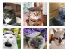
Gatti divertenti, su Instagram come Donald ...