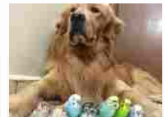
Il cane Bob e la sua famiglia allargata (Fo...