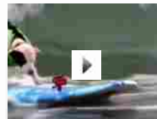
Cani da surf (VIDEO)

Nessuno forse poteva immaginare che un giorno il Doberman Pinscher sarebbe diventato il cane elegante e rassicurante che è adesso. La razza nasce da un particolare miscuglio, effettuato da Louis [...]