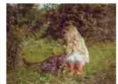
Bambini e gattini, amicizia perfetta -...