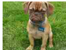
Grumpy Dog, più cattivo di Grumpy Cat R...