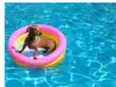
Pool party, animali che amano la piscina &#...