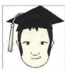
di F. BONA (federicobona.it)

➤ Chissà, forse il nostro baraccone editoriale stavolta partirà davvero, per sfruttare il Natale (nel fattempo Newton Compton ha iniziato a vendere contemporaneamente, e bene, libri in versione cartacea ed elettronica). Di certo in America gli e-book galoppiano più veloci del previsto. E Amazon, dopo aver parato l'attacco dell'iPad, ha lanciato un nuovo Kindle più piccolo e sottile (foto) che, se fosse appena pubblicizzato, farebbe sfracelli anche da noi. Costa 189 dollari (145 €) e si prenota su www.amazon.com .