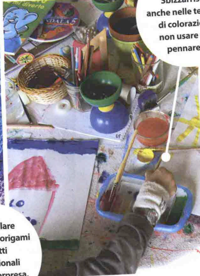
Sbizzarrisciti anche nelle tecniche di colorazione, non usare solo pennarelli!