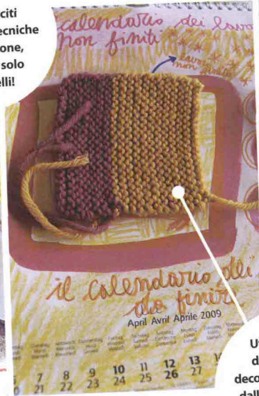
Utilizza vari tipi di materiali per decorare ogni pagina, dalla stoffa alla lana, dai fiori secchi al collage.