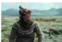
Se salvare il mondo è illegale