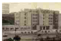
Genova, il sotterraneo dei