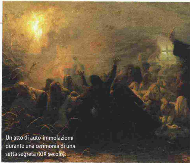
Un atto di auto-immolazione durante una cerimonia di una setta segreta (XIX secolo).

La passione per i complotti (ovvero il complottismo come abito mentale) continua a diffondersi, diventando un'ossessione di massa, una psicosi. Ragionare