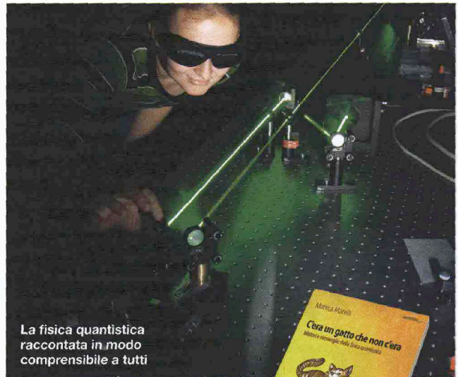
La fisica quantistica raccontata in modo comprensibile a tutti

C'era una volta la televisione, ossia l'intrattenimento domestico per eccellenza. "Da sempre davanti alla TV si discute, ci si commuove, ci si addormenta; da quando abbiamo un telecomando in mano facciamo anche zapping, registriamo dei film, controlliamo il televideo", scrive Emmanuel Mazzucchi in un capitolo del libro. Ma oggi molte attività che prima si svolgevano "attorno" alla TV, ora avvengono "con" la TV, soprattutto in quei casi in cui "la visione tradizionale si ibrida con applicazioni Internet, personal video recorder e dispositivi mobili vari". La televisione è così costretta a reinventarsi come strumento connesso alla Rete, entrando in competizione con i giganti del web o dei multimedia. Una trasformazione che è ricca di prospettive e di traguardi che fino a qualche anno fa erano davvero imprevedibili.